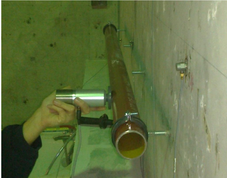
Abbildung 1: Prüfaufbau zur Bestimmung der Einfügungsdämmung: 4“ SML-Rohr mittels fischer Rohrschellen am Empfangsplattenprüfstand befestigt; Anregung des Rohres mit einem Kleinhammerwerk