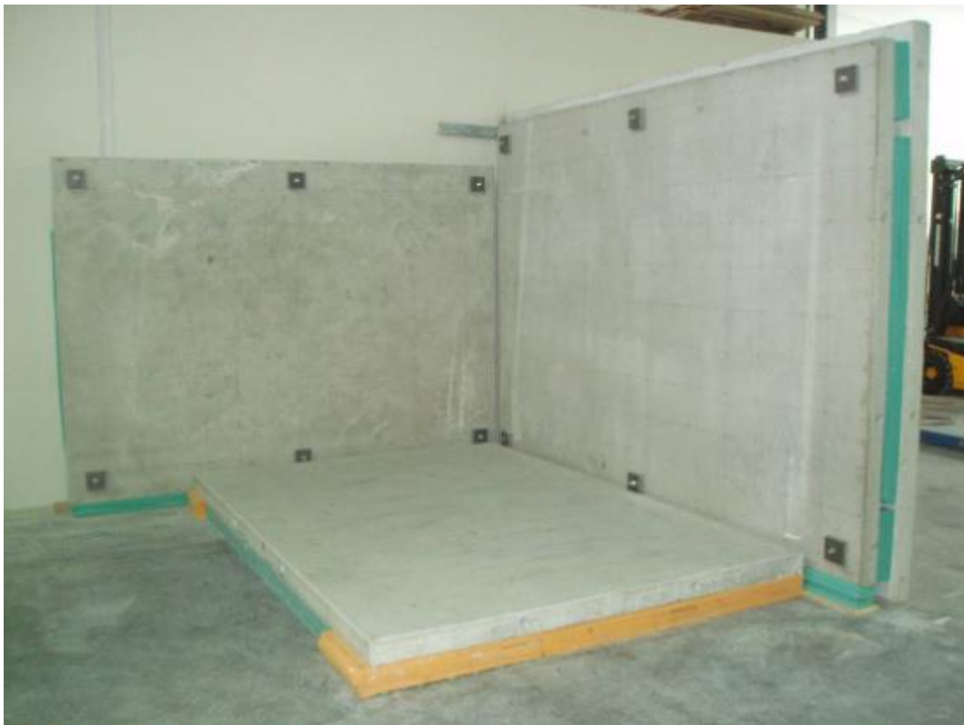
Abbildung 2: Empfangsplattenprüfstand der Hochschule für Technik Stuttgart