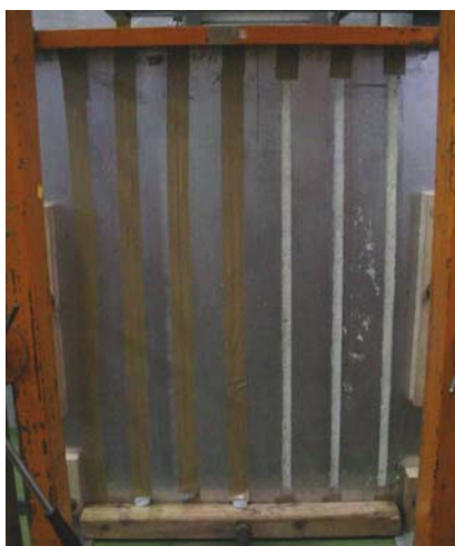
Abbildung 1 Geschäumte Fugen in Prüfvorrichtung für Längsfugen nach DIN 18542, aufgebaut auf dem Fensterprüfstand